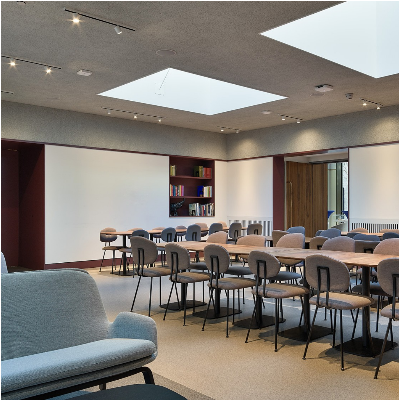
KNAW in Amsterdam, in den Niederlanden