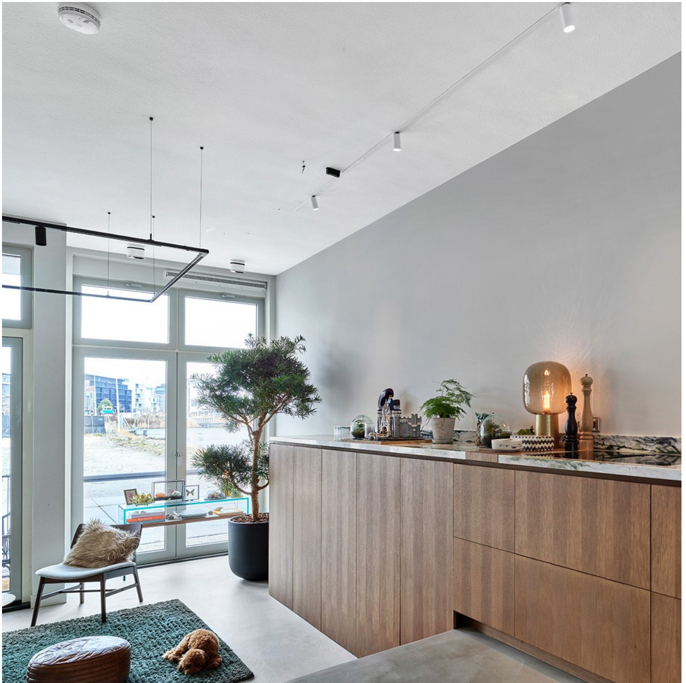
Apartment Houthavens Amsterdam, the Netherlands

Weitere Informationen finden Sie in unserem Standard-Detailset. Zudem können Sie Kontakt mit unseren Spezialisten unter der Telefonnummer +49 (0)2871 3474030 aufnehmen oder eine Email senden an: info@acosorb.de